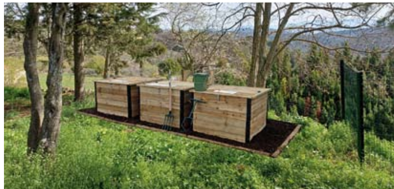
Site d'installation envisagé dans le parc Jean Fabre.