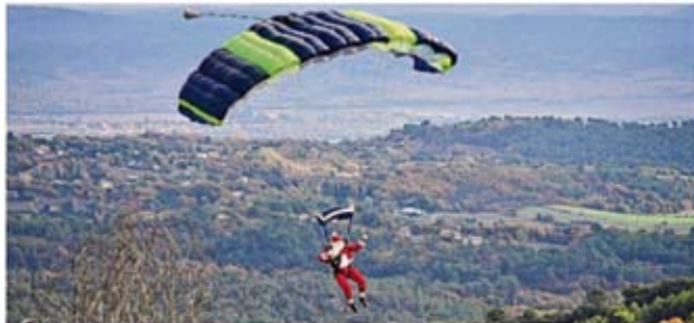
Un marché de Noël au profit des enfants de l'école.

Mais qu'à cela ne tiennent, il s'agit d'une poignée de personnes motivées pour arriver à organiser avec l'aide de la municipalité,