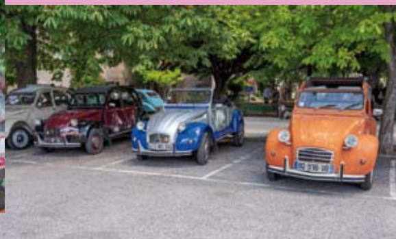
Dimanche 10 juillet : rassemblement 2 CV et véhicules anciens.