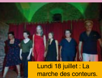
Lundi 18 juillet : La marche des conteurs.