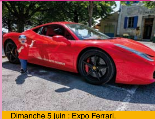
Dimanche 5 juin : Expo Ferrari.