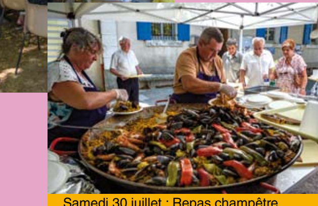
Samedi 30 juillet : Repas champêtre.