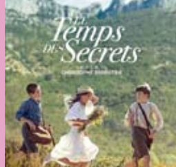
Vendredi 5 août : Cinéma de Pays.