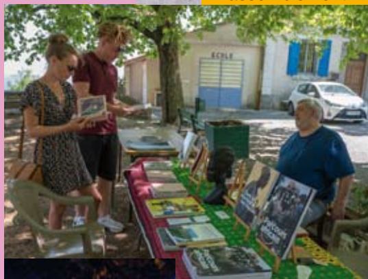
Dimanche 17 juillet : Livres et revues en vrac.