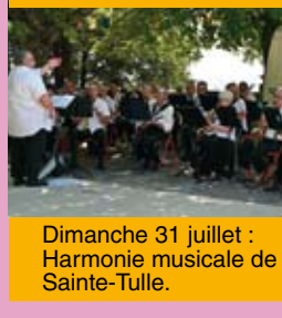
Dimanche 31 juillet : Harmonie musicale de Sainte-Tulle.