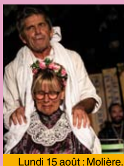
Lundi 15 août : Molière.