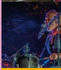
Samedi 13 août : Hit Hit Hit