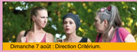
Dimanche 7 août : Direction Critérium.