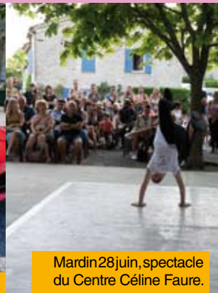
Mardi 28 juin, spectacle du Centre Céline Faure.